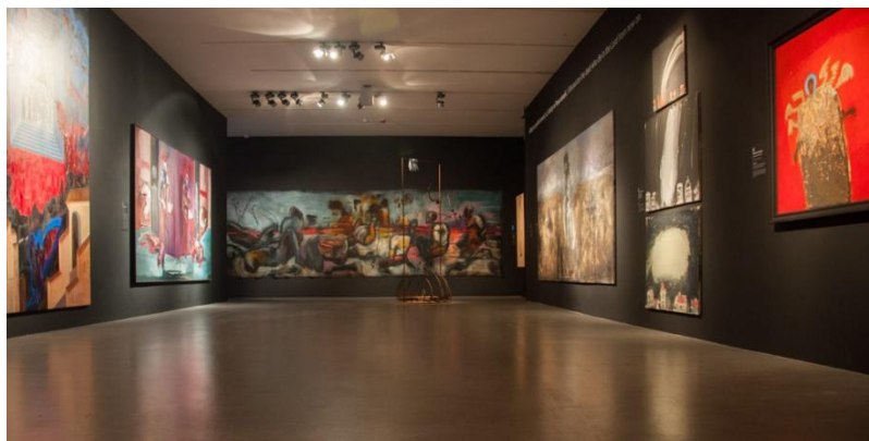
Foto z wystawy/Znaki Apokalipsy. Międzynarodowa Wystawa Sztuki Współczesnej w Centrum Sztuki Współczesnej Znaki Czasu w Toruniu