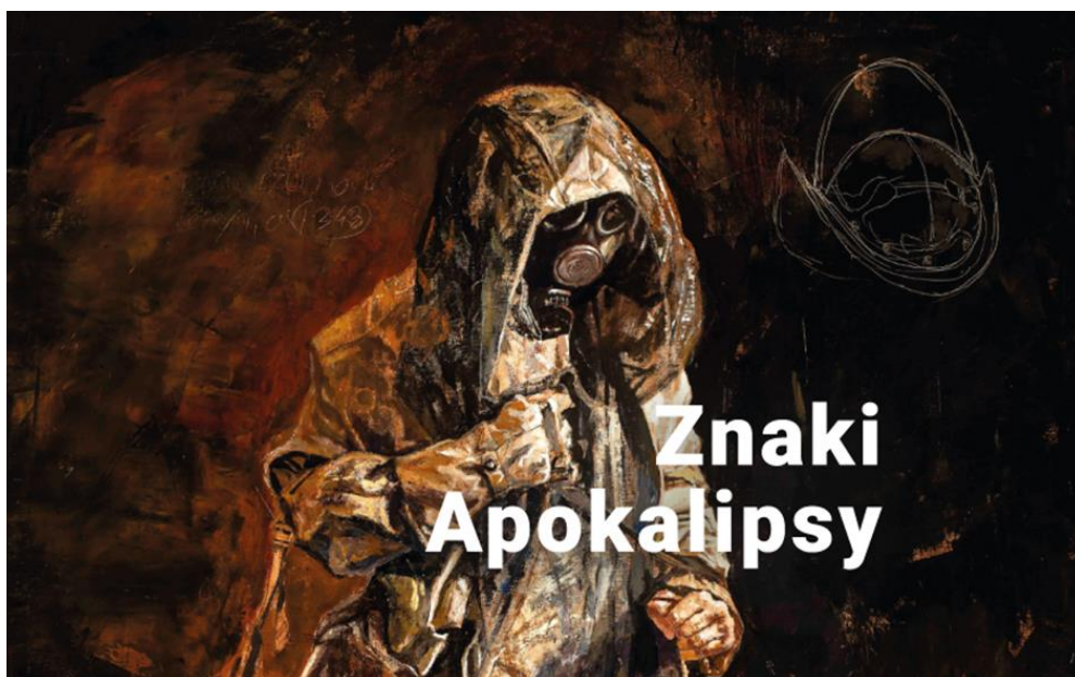
Plakat z wystawy /Znaki Apokalipsy. Międzynarodowa Wystawa Sztuki Współczesnej w Centrum Sztuki Współczesnej Znaki Czasu w Toruniu