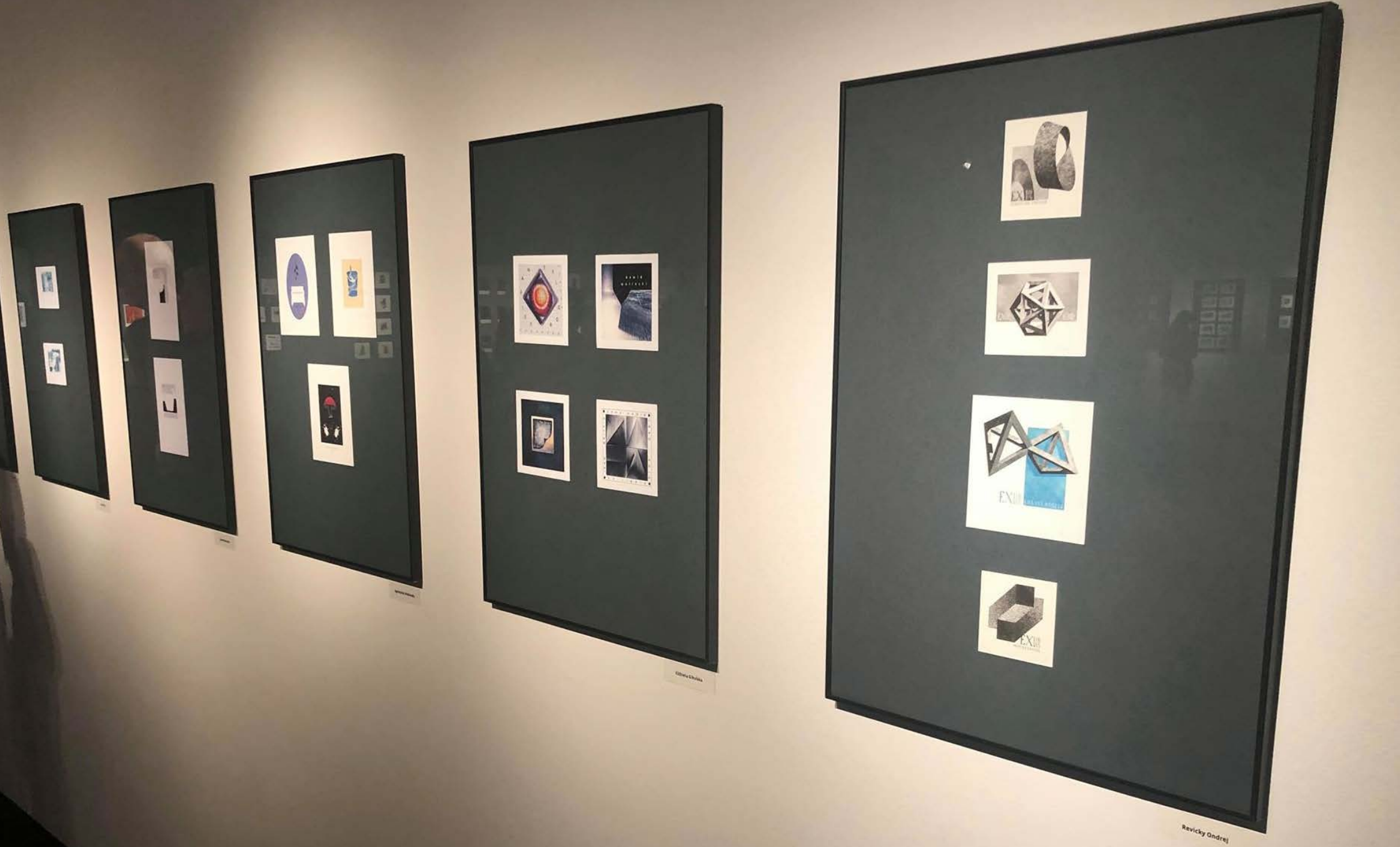
Ondrej Revický, 4 Ex Librisy na wystawie Ex Digitalis salon 2019 – Międzynarodowy Przegląd Ekslibrisu Cyfrowego, CSW Znaki Czasu, Toruń, 2019