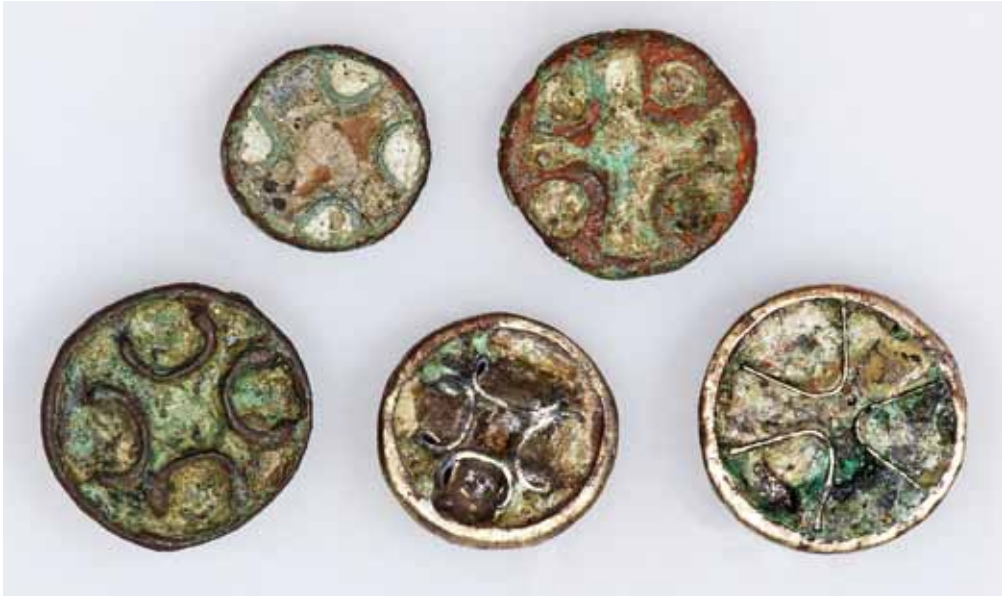
Abb. 9. Die Kreuzemailscheibenfibeln von Eisdorf sind frühe Zeugnisse der Christianisierung in Sachsen

Klarheit über die Bebauung dieses heute als Acker genutzten Areals. Allerdings sind hier seit ca. 15 Jahren Oberflächenfunde getätigt worden, die möglicherweise die Frage nach der Lage des Merseburger Hofes beantworten. In diesem Zusammenhang sind vor allem die Emailscheibenfibeln (Abb. 9) und Messerscheidenbeschläge von Interesse, gestatten sie doch zusammen mit einer Münze eine nähere zeitliche Einordnung und geben Hinweise auf das kulturelle Umfeld. Bei der Münze handelt es sich um einen jüngeren Randpfennig des späten 11. Jahrhunderts, für den die Münzstätten von Halle-Giebichenstein, Merseburg oder aber auch eine nicht näher lokalisierbare in Polen in Frage kommen (Hollstein 2011).