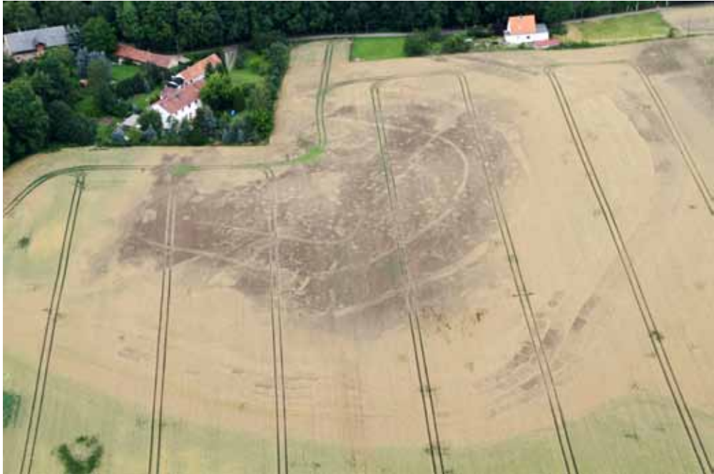
Abb. 6. Hof/Stauchitz. Aus der Luft sind die Abfolge von Gräben, die Kastenkonstruktion des äußeren Walls sowie zahlreiche Gruben deutlich erkennbar

halten gewesen sein, dass die Geodäten im sächsischen Meilenblatt an dieser Stelle einen „Burgberg“ kartierten. Die volle Ausdehnung und die vielen Strukturdetails der Anlage offenbarten sich jedoch erst durch Luftbilder, geomagnetische Messungen und Ausgrabungen nach 1992. Die Burg besteht aus drei Grabeneinfriedungen im Zentrum und aus einer massiven, mehrfach verstärkten