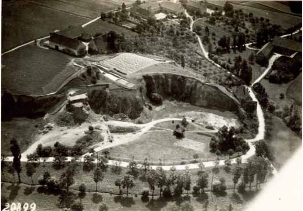
Abb. 4. Luftbildarchäologie 1927 – Die Grabungsflächen in Köllmichen zeichnen sich deutlich ab (Ortsakte „Köllmichen“;)