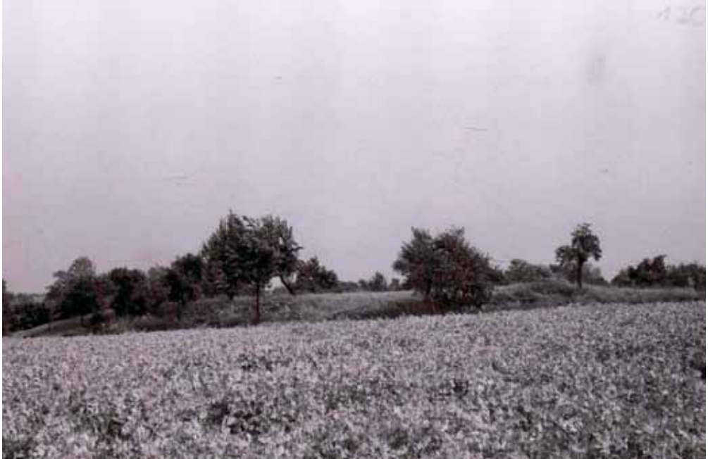
Abb. 5. Der Tanzberg bei Paltzschen vor 1976 (Ortsakte „Paltzschen“)

Rest des „Tanzbergs“ von Paltzschen bei Lommatzsch zur Gewinnung von Ackerland mit Hilfe von Planiermaschinen eingeebnet (Abb. 5). Die Zerstörung wurde erst 1981 aktenkundig und von Werner Coblenz, dem Direktor des Landesmuseums für Vorgeschichte in Dresden als so gravierend angesehen, dass er den Tatbestand unverzüglich zur Anzeige brachte. Die verantwortliche Staatsanwaltschaft teilte diese Sicht nicht und stellte das Verfahren nur wenige Monate später ein, da davon auszugehen sei, dass die Verantwortlichen nicht vorsätzlich gehandelt hätten (Ortsakte Paltzschen). Heute unterliegen die Reste der sich in Ackerland befindlichen Burgwälle der schleichenden Zerstörung durch Bodenerosion und Bodenverschleppung in Folge von ackerbaulicher Nutzung.