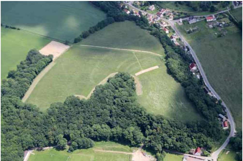
Abb. 7. Der Zschaitzer Burgberg ist heute extensiv genutztes Grünland. Blühstreifen und Steinrücken kennzeichnen Gräben und den Hauptwall

Durch eine äußere Befestigung konnte die geschützte Fläche von 1,4 auf ca. 6 ha vergrößert werden. Die frühmittelalterliche Burg muss zerstört worden sein, denn Hölzer, Lehm und Steine weisen Brandspu-