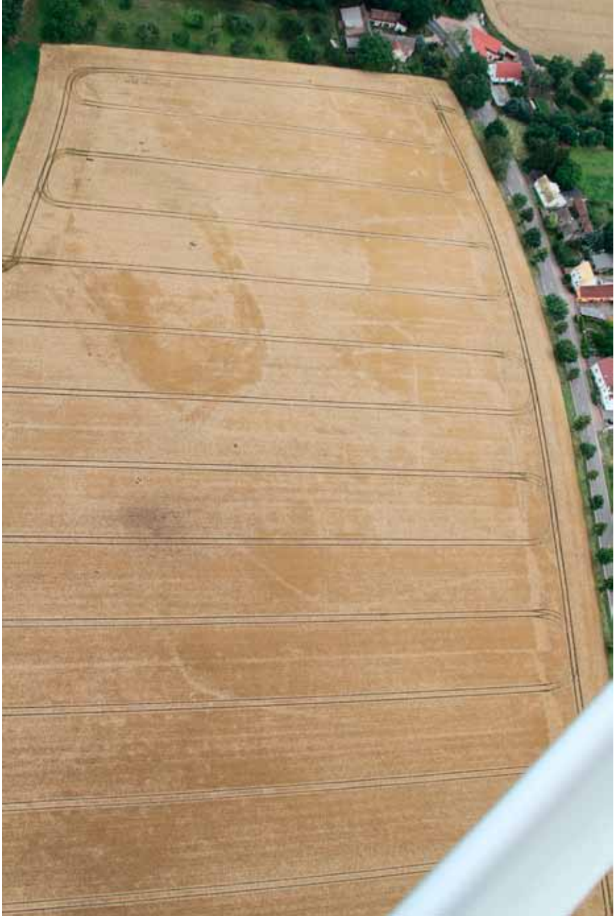
Abb. 8. Der Hof des Thietmar von Merseburg unmittelbar westlich des heutigen Eisdorf ist auch im trockenen Sommer 2018 im reifenden Weizen sichtbar