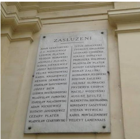
Pierwsza tablica zasłużonych dla Towarzystwa Historyczno-Literackiego i Biblioteki Polskiej w Paryżu (po lewej stronie atrium, patrz od wejścia do siedziby instytucji).