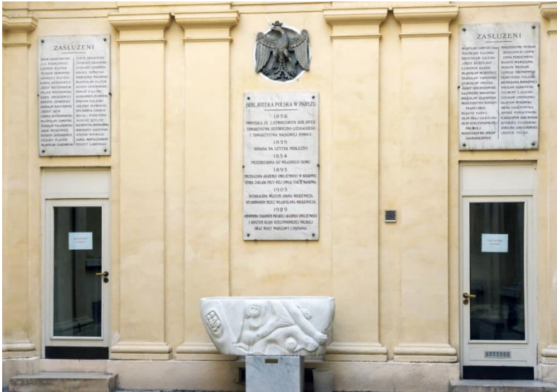
Widok na tablice pamiątkowe (historia Biblioteki Polskiej w Paryżu oraz zasługi) w atrium siedziby Towarzystwa Historyczno-Literackiego i Biblioteki Polskiej w Paryżu (Quai d’Orléans 6).