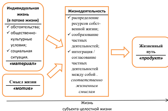
Рис. 1. Психологическая структура жизнедеятельности личности как субъекта жизни

Наиболее целостно и полно проблематику жизнедеятельности личности в контексте ее жизненного пути анализировали К. Абульханова [1981, с. 19–45], [1987, с. 137–145], а в последнее десятилетие, в том же русле, – К. Карпинский [2010, с. 184–202]. Ценность данного подхода состоит в рассмотрении категории жизнедеятельности в рамках теории деятельности, как метадеятельности по преобразованию жизни (как материала) в жизненный путь (ее продукт) (рис. 1).