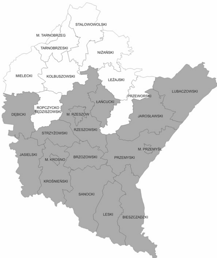
Ryc. 2. Obszar koncentracji działań na rzecz podnoszenia konkurencyjności produktów turystycznych

O ile dwa pierwsze kierunki powinny być realizowane na obszarze całego Podkarpacia, o tyle kierunek trzeci – w ramach OSI, obejmującego południową i środkową część regionu (ryc. 2).