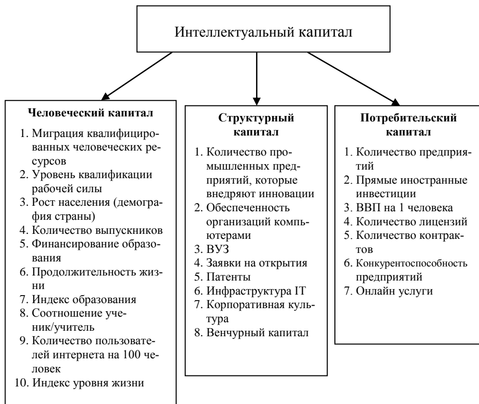
Рис. 1. Структура интеллектуального капитала

ально-экономической безопасности в условиях евроинтеграции страны и глобализации невозможно без наличия соответствующего уровня интеллектуального потенциала и капитала.