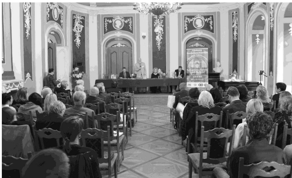
sesja otwarcia IX Konferencji Filozofów Krajów Słowiańskich