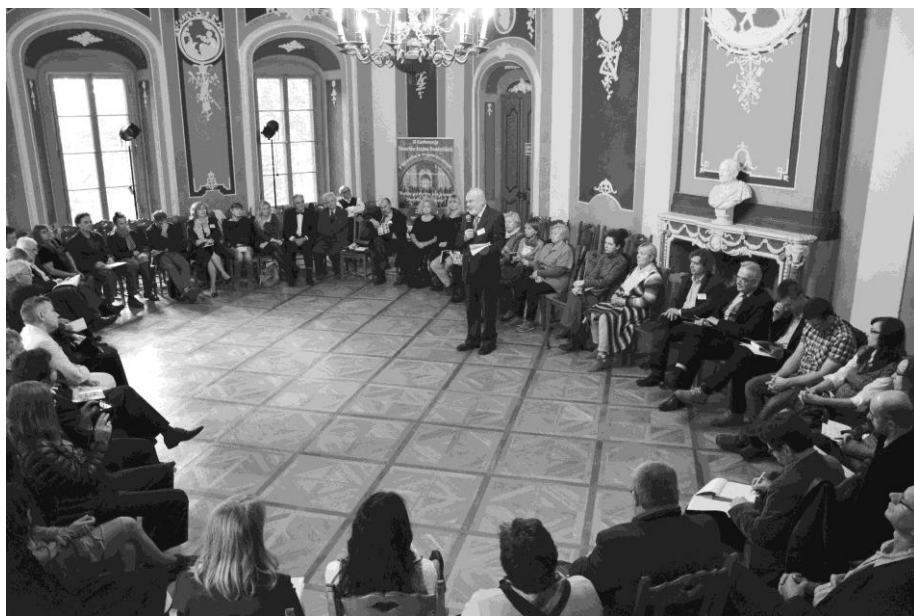
Deбата Okrągłego Stołu Filozofów Krajów Słowiańskich (23 IX 2014)