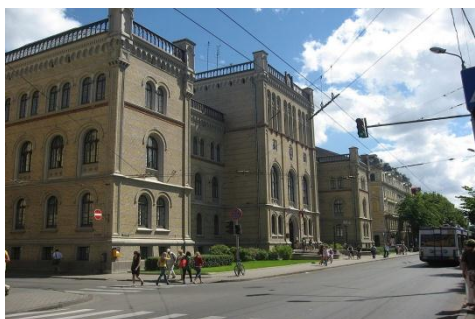
Uniwersytet Techniczny w Rydze

W bibliotece obecnie zatrudnionych jest 71 osób. Bibliotekarze angażują się w tworzenie wystaw, organizowanie corocznych imprez: „Tydzień Bibliotekarza” i październikowe obchody „Open Access”.